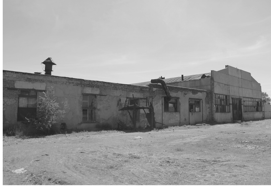
Кейбір белгілерін Ресей жағы алып кеткісі келеді дейді. Бұл жөнінде бір шешім жасалды ма?

– Шыны керек, баспасөз беттерінде ара-тұра көтеріліп жүргеніміз, біздің мәдениет органдары қуғын-сүргіннің қым-қуыт ізі жатқан құнды мұраларды жете бааалап ескермеді. Қиы тағдырды еске салатын Степлагтың қалқиван қабырғалары мен