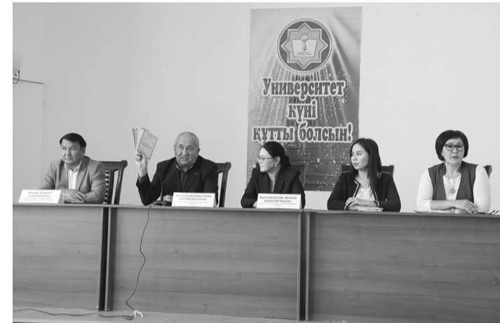
Қазақстан Республикасы Президентінің жолдауы

Алдымен Қ.И.Сәтбаев атындағы №7 мектеп-лицейінің оқушыларымен кездескен олар, сөз басында Елбасының «Рухани жаңғыру» бағдарламасына да тоқталып, оның негізгі мән-мақсаты және бүгінде атқарылған шаруалар жайында тәзікелен өтті. – Еліміз тәуелсіздік алғанда көптен күткен азаттығымыздың баянды болатынына көп адам сенбеді. Уақыт өте экономикамыз түзеліп, әлеуметіміз қалыпқа келді. Содан соң Елбасы Нұрсұлтан Назарбаев «Қазақстан-2030» Стратегиялық бағдарламасын қабылдады. Аталмыш бағдарлама негізінде жемісті жұмыстар атқарылып, әлемдегі алғашқы елу елдің қатарына қосылдық.