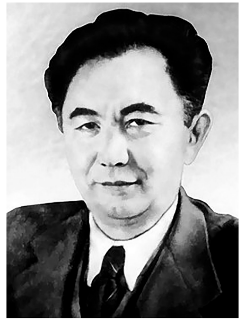
Мұндайды көрген бұрын Совет халқы, Жояды бұл қайғыны еңбек жалпы. Артылса бардағыдан ғылым жұмыс, Қайырлы болғаны сол – ердің арты.

Ғылымның Қазақстан ордасына, Сынарлық келді жұмыс зор басына. Бұл сыннан жас ғалымдар шауып өтіп, Орданың шығар барып өр басына.