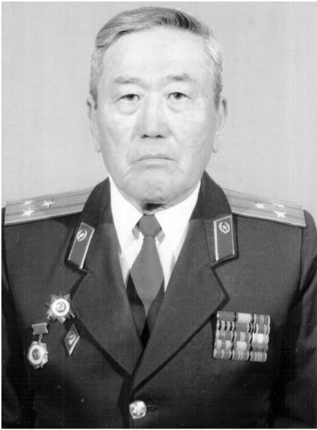
Биыл Екінші дүниежүзілік соғыс аталған алапат зұлмдықтың ақталғанына, Ұлы Жеңіске 75 жыл толғалы отыр. Адамзат баласына қанды қырғын мен қасірет әкелген бұл зұлматтың қайғысы әлі де сейіле қойған жоқ.

Халықта «Ерлік – елге мұра, ұрпаққа – ұран» деген даналық сөз бар. Ұлы Отан соғысына қатысқандар мен құрбан болғандардың бәрі де Жәніс күнін жақындатуға жанқиярлықпен үлес қосқан батырлар деп айтуға болады.