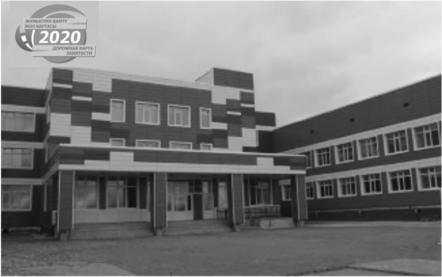
орындық балабақшаның құрылысы аясында болды. Оның құрылысы «Жұмыспен қамтудың жол картасы» ге жуық адам жұмыс орындарымен қамтылмақ.

Сәтбаев қаласында Жол картасы аясында тұрғын үй-коммуналдық шаруашылығы, білім беру, құрылыс, денсаулық сақтау салалары бойынша 18 жоба жүзеге асырылуда. Үш балабақшада, төрт мектепте күрделі жөндеу жұмыстары басталды. Аурухананы күрделі жөндеу жоспарланған. Жолдар қалыңға келтіріле бастады. Барлық жобалар бойынша 800-