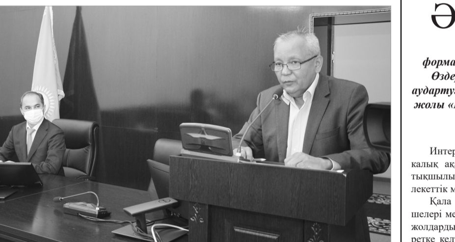
Қайрат Әбсаттаров эсерліктің бұқаралық ақпарат құралдары өкілдері, қоғам белсенділерімен кездесіп, қаланың дамуына қатысты ұсыныс, пікірлерін тыңдады.

Қала әкімі Қайрат Әбсаттаровтың тарағалығымен коммуналдық сала мәселелеріне арналған жиын өтті. Алдыңғы аптада шаһар басшысы жылымен қамтамасыз ету, жылы маусымына дайындық жайын пысықтап, сейсенбі күні өткен жиында ауызсумен кідіріссіз қамтамасыз ету және ауыстырылып жатқан су құбырларының жай-күйі күн тәртібіне шығарылды.