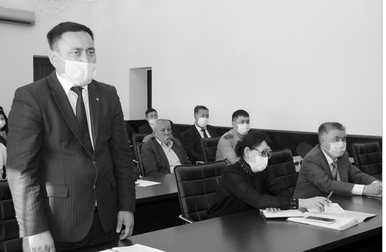
Қайрат Әбсаттаров эсерліктің бұқаралық ақпарат құралдары өкілдері, қоғам белсенділерімен кездесіп, қаланың дамуына қатысты ұсыныс, пікірлерін тыңдады.

Әкімдікте сейсенбі күні өткен аппараттық жиында шаһар басшысы Қайрат Әбсаттаров коммуналдық қызметтерге осындай тапсырма жүкттеді.