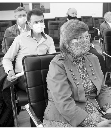
Қайрат Әбсаттаров эсерліктің бұқаралық ақпарат құралдары өкілдері, қоғам белсенділерімен кездесіп, қаланың дамуына қатысты ұсыныс, пікірлерін тыңдады.

– Қоғамда бар проблемалар да, жетістіктер де БАҚ-та, әлеуметтік желіде жан-жақты жарияланып жатады. Оның барлығына біз құлақ түріп,