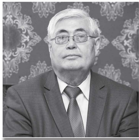
тегеурінін күшейту жолында алдағы уақытта не істеуге болады?

– Теңгенің тұзғыры тұрақты болуы еліміздің экономикалық жағдайына да байланысты ғой. Бірнеше рет шарпыған әлемдік қаржы-экономикалық дағдарыстарын да аман-есеп бастан өткердік. Қазіргі пандемия індеті тұсындағы күрделі жағдай да кім-кімге болсын үлкен сынақ болуда. Айеке, өзіңіз қалай ойлайсыз, доллардың бағамына сәйкес бір құлдырап, бір көтеріліп тұрған теңгеміздің