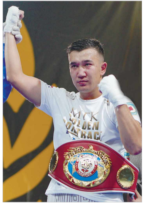
екінші белбеуді тағыпса деген мақсаты барын жеткізді.

Соңғы жылдары айрықша дамып келе жатқан Жезқазған боксшының абыройы кезекті жеңіспен асқақтады.