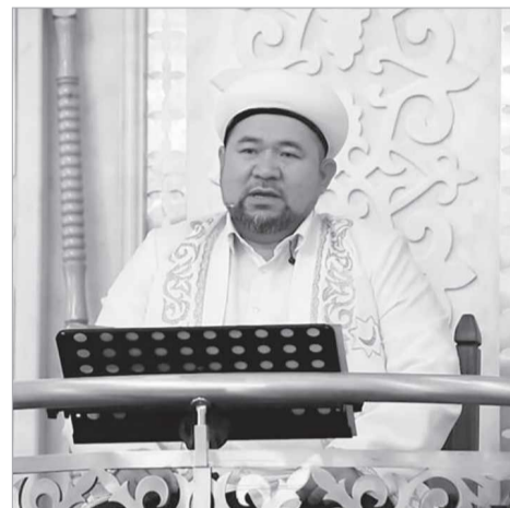
ел тұрғындары діни маңызды мәселелерге бетпе-бет келгенде неге мән беруге мәжбүр есетіміз?

— Қазір діни білімі болмаса да, «құл нұлланы» білетін екі адамның бірі қоз алдымызда пәтуа шығарғын, бір мәселелерге жауап айтқыш болып кетті. Қарапайым