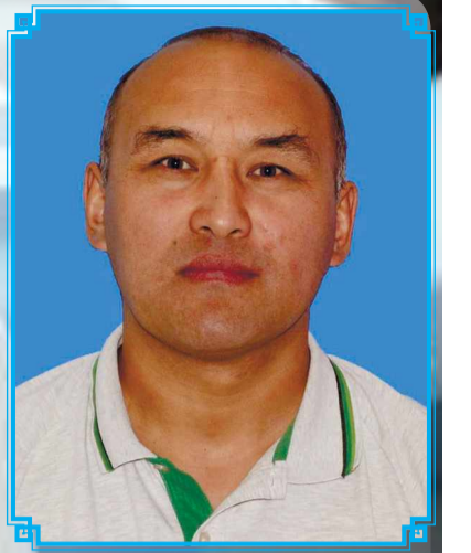
Бала-шаға қызығына кенеліп, Ортамызда аман-есен жүріңіз.

Ердің жасы Елуге де келдіңіз, Алла берген жасқа құлаш сермеңіз.