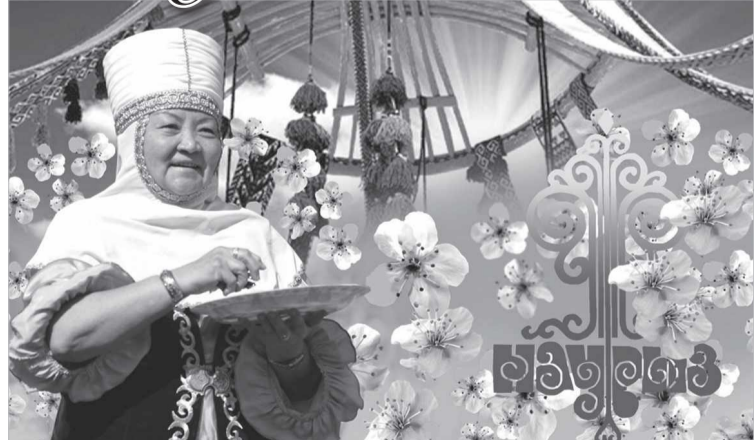
(Соңы. Басы 1-бетте).

Өз кезегінде мұндай іс-шаралар адамдардың жүрегіне ұлттық сезімін құйып, көңіліндегі сәулені байытуға игі әсерін тигізгені анық. 2010 жылғы 19 ақпандағы Біріккен Ұлттар Ұйымы Бас Ассамблеясының 64-сессиясында «Әлем мәдениеті» бағдарламасының 49-тармағына сәйкес «Халықаралық Наурыз мерекесі» деп