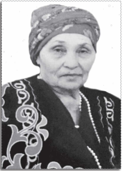
(Соңы. Басы 1-бетте)

Мұғалімнің негізгі міндетіне кірмейтін жұмыстардан босату жалпы нормада көрсетіледі. Мұғалімнің мәртебесін көтеретін тағы бір мәселе, олардың еңбегін дер кезінде әділ бағалап, көтермелеп, ынталандырып отыру керек. Мерзімдік басылымдарда, ведомствалық газет-журналдарда мұғалімнің жылт еткен жақсылығы мен жаңалығы жарияланып тұрса, оны ел көреді. Құрметтейді. Беделін көтереді.