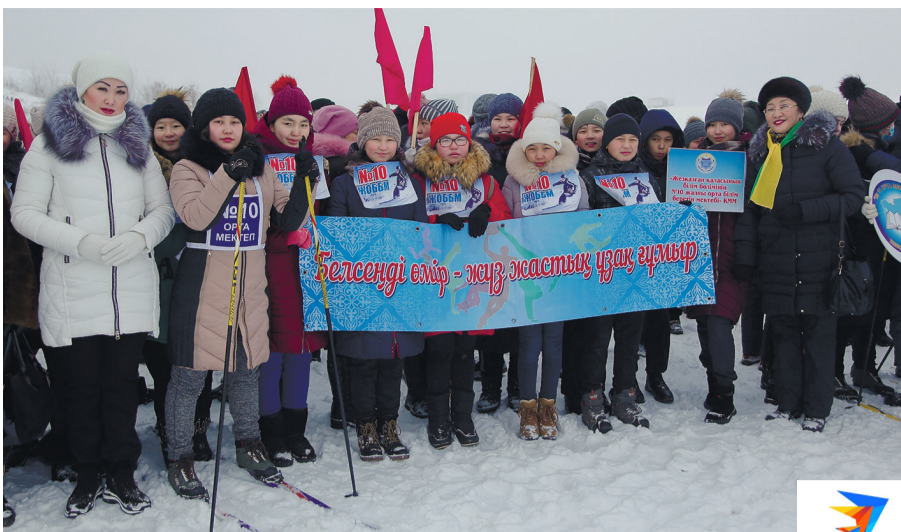
Кеңгір су қоймасында Жастар жылы мен қаламыздың 65 жылдық мерейтойына орай қалалық «Шаңғы – 2019» жарысы өтті.

мектептің оқушылары жоғары көрсеткіш көрсетті. II орынды №4 мектеп және жүлделі III орынды №11 орта мектеп оқушылары жеңіп алды.